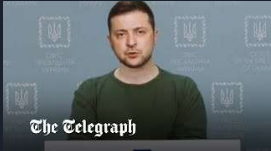
Deepfake di Volodymyr Zelensky, Marzo 2022 ( TheTelegraph )